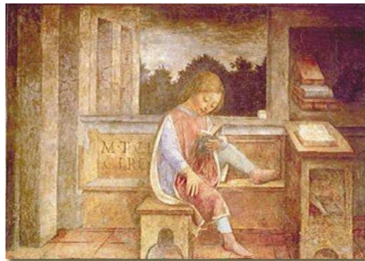
Barbara Peroni - 6 nov 2009